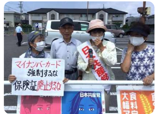
地域のみなさんと健康保険証廃止の中止を宣伝

国会では、しっかり審議するべき内容の法案が、自民・公明・維新・国民などによって次々と強行成立が進められています。