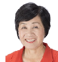
市議会議員 ひこさか和子

「桜」疑惑、カジノ汚職 — 真実を明らかにし逃げ切り許さない！ 消費税を緊急に5%に減税し社会保障充実・暮らし応援に切り替える！ 国会の審議なしの中東地域への自衛隊派兵・憲法9条改定を許さない！ 日本共産党は、野党連合政権の合意の実現に全力をあげます。