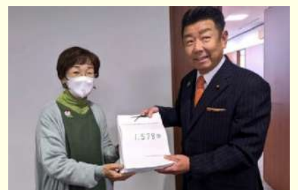
小中学校給食費の補助を求める緊急請願署名を一宮市議会へ提出