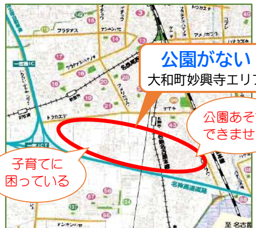
一宮市の都市公園マップ